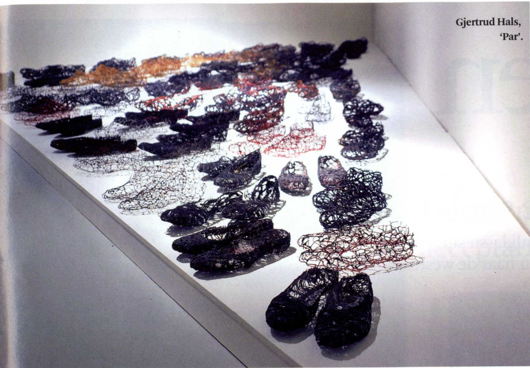
Gjertrud Hals, 'Par'.